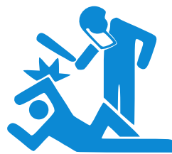
Ataques de integridad física