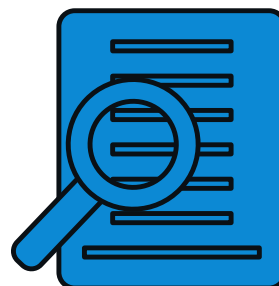
Estigmatización de las denuncias